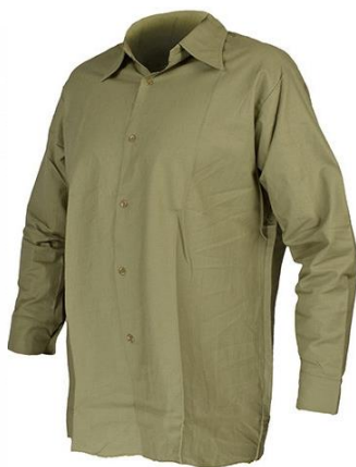
Tabulka velikostí košil